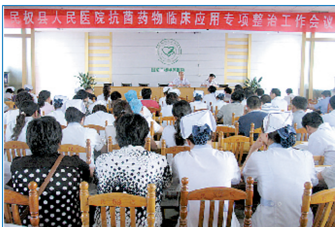
7月4日,民权县人民医院召开了由中层管理人员参加的抗菌药物临床应用工作会议。会议要求全院医务人员围绕抗菌药物临床应用中的问题和关键环节进行整改治理,完善抗菌药物临床应用管理长效机制,提高抗菌药物合理应用水平,确保人民群众健康和用药安全。